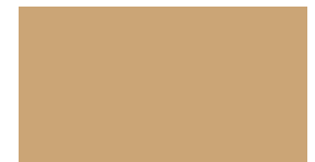
SW 9024 Vintage Gold SW 9024 Doré rétro