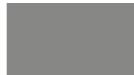
SW 9156 Gris Morado SW 9156 Gris violet