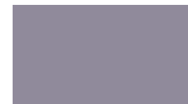
SW 9074 Gentle Grape SW 9074 Raisin doux