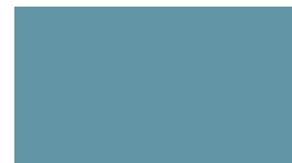
SW 6494 Lakeshore SW 6494 Rive