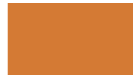
SW 6650 Marquis Orange SW 6650 Orange marquis